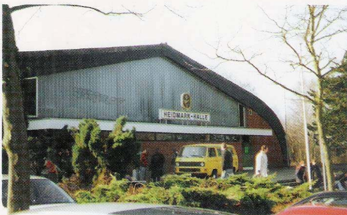
Heidmark-Halle: Hier tobte die Computer-Party zu Ostern 97 – drei Tage rund um Bits, Bytes, Musik und viel Spaß